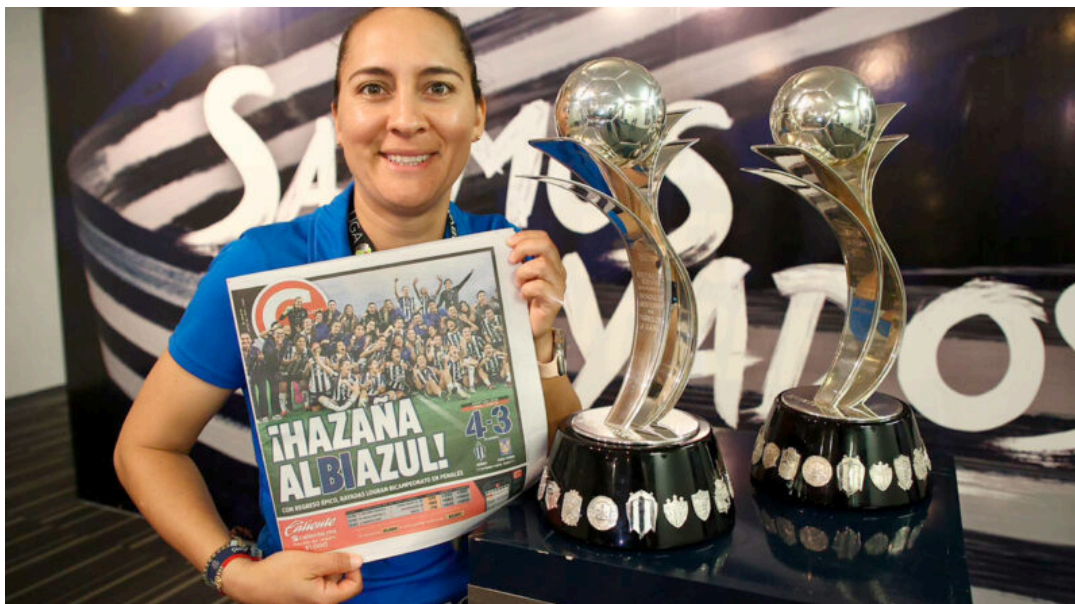
Amelia lleva dos títulos seguidos con las Rayadas en la Liga MX.