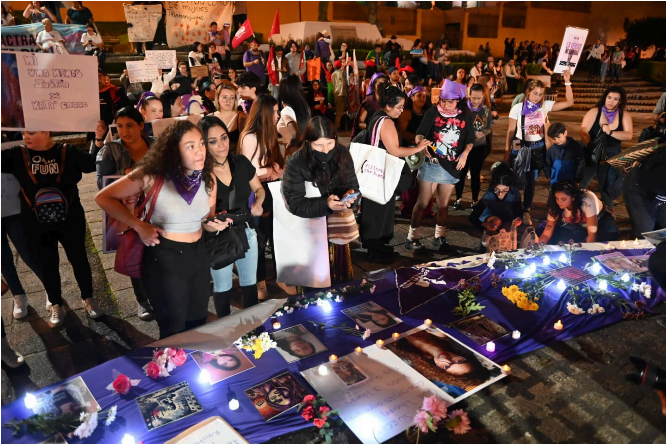
La marcha concluyó en la plaza de la Democracia donde honraron a las víctimas, cuyas fotos fueron puestas en una especie de altar.