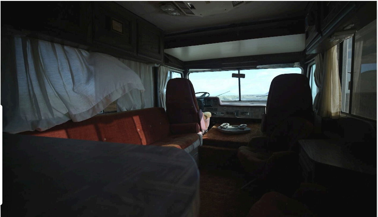
Jan Broberg A Friend of the Family