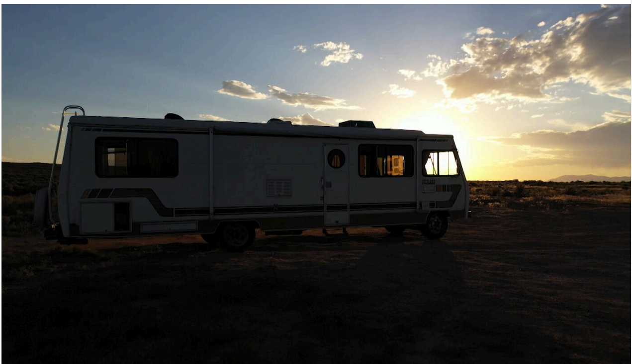
Jan Broberg A Friend of the Family

Tanto el documental como la serie “Un amigo de la familia” se pueden ver en Universal +.