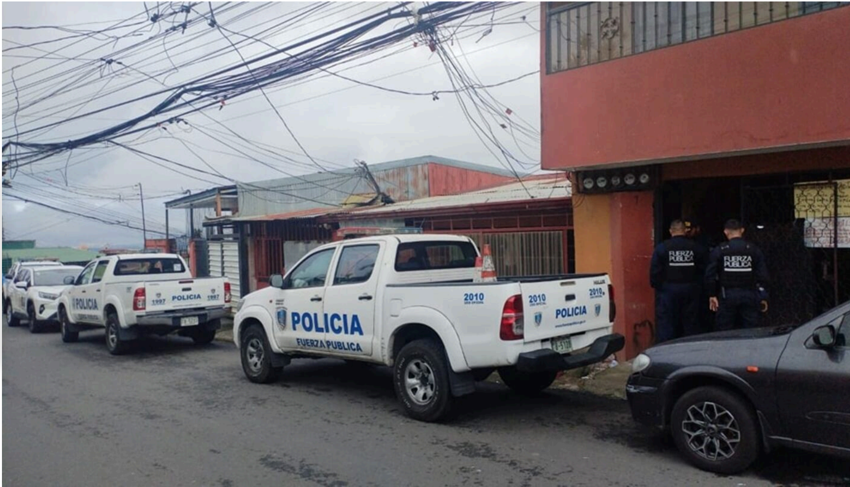
El sospechoso se entregó a las autoridades.