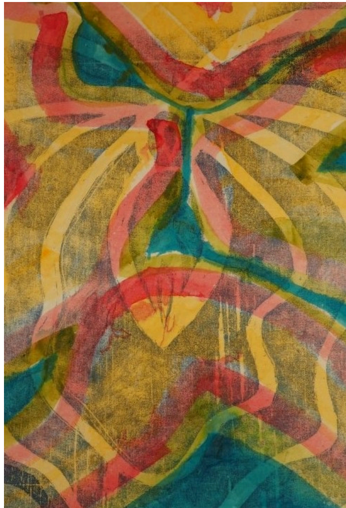
Autora: Lucía Cordero. De la serie Organismos múltiples, xilografía. Año: 2021.[/caption]

[caption id="attachment_328043" align="alignnone" width="489"]