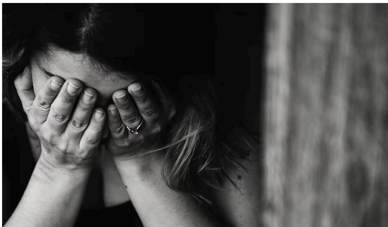
Datos del 2020 al 2022 muestran como va hacia la alza los maltratos hacia las mujeres.