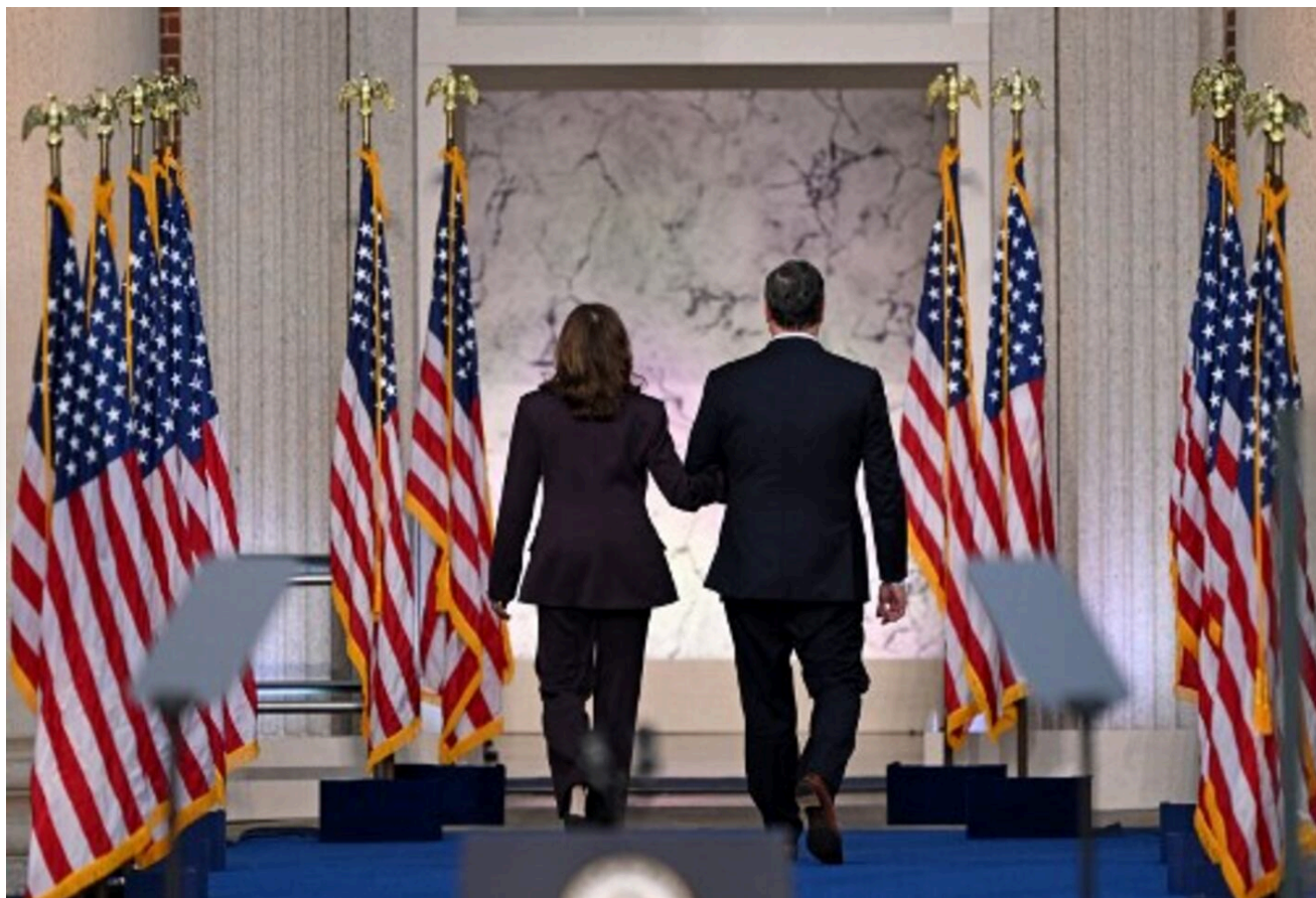
Harris y su marido, Doug Emhoff, se van después de que ella pronunció su discurso el 6 de noviembre del 2024.

FIRMAS PRESS. - Donald Trump ganó su regreso a la Casa Blanca por un margen mucho más amplio de lo que habían pronosticado las encuestas anteriores a la elección. Los sondeos indicaban un virtual empate entre Trump y la vicepresidenta, Kamala Harris. El resultado fue muy distinto : Trump se alzó con 295 votos del Colegio Electoral y Harris con 226.