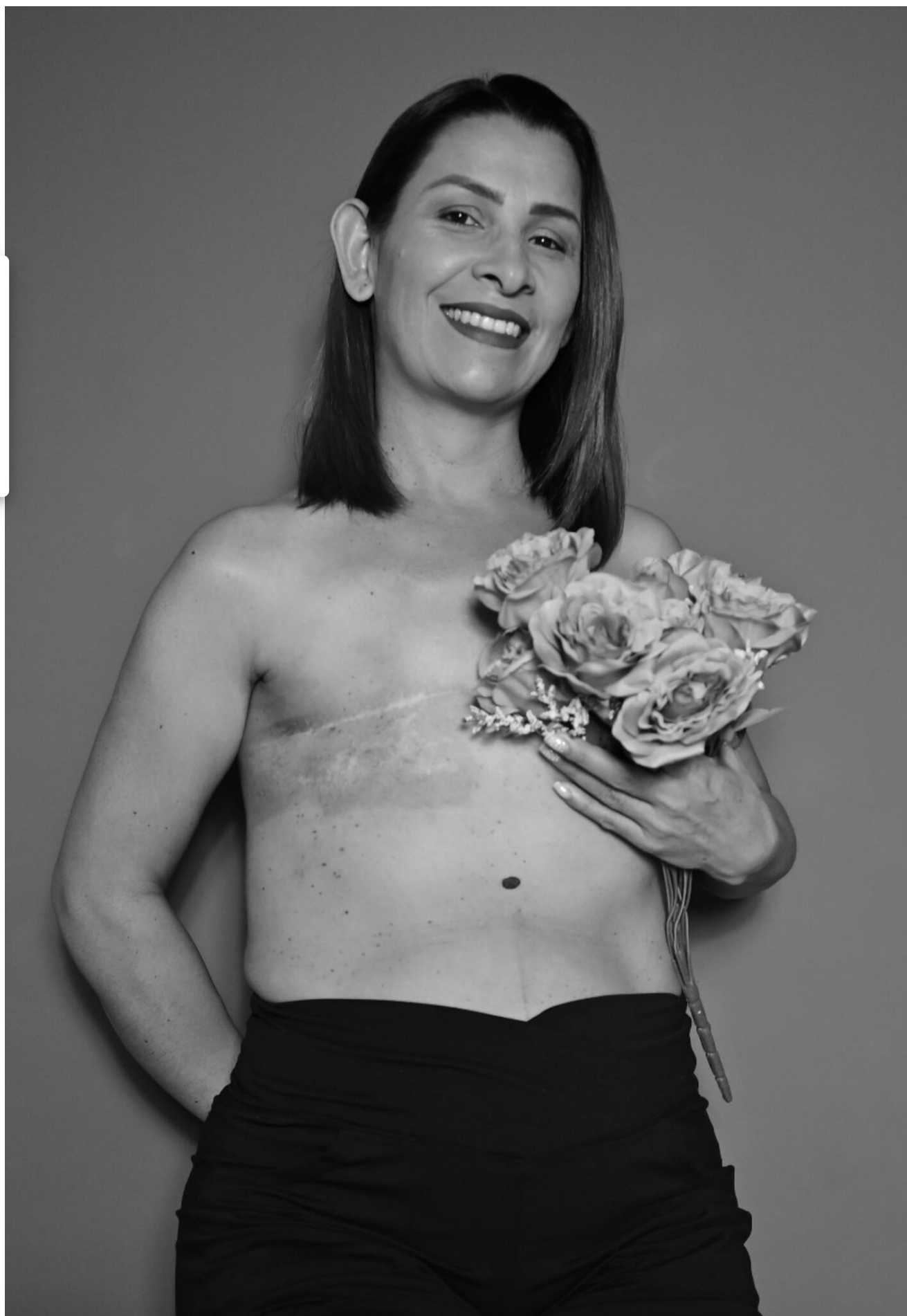
Rodríguez quiso ser parte de una hermosa muestra fotográfica que hay en el hospital de Quepos.