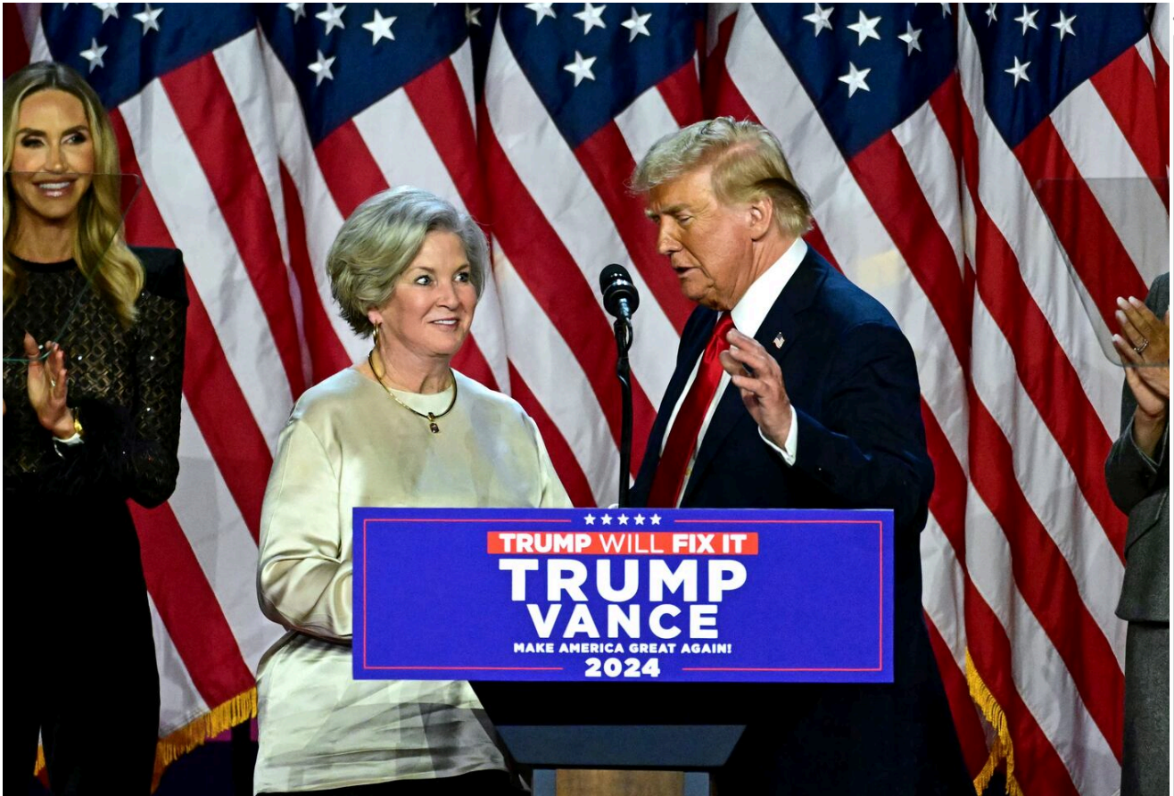
Donald Trump saluda a su jefa de campaña, Susie Wiles (izq.), durante un evento de la noche de las elecciones en el Centro de Convenciones de West Palm Beach en Florida. Wiles es la primer mujer jefa de gabinete tras el nombramiento de Trump.