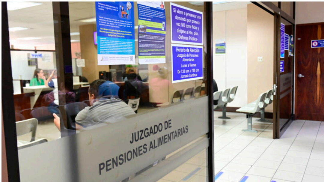
Obligados alimentarios pueden ir a la cárcel por impago.