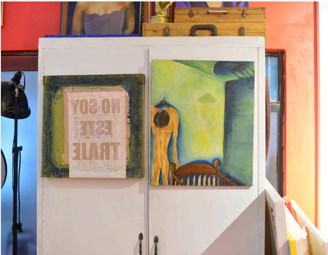
'Traje Humano', la primera obra surrealista de Man Yu, simboliza el dolor y el peso que cargaba en su infancia, cuando sufrió acoso escolar.

Aunque con el tiempo descubrieron su secreto y le prohibieron encerrarse en el baño, su pasión por crear no se apagó. La misma soledad y la barrera del idioma causó que no tuviera el mejor desempeño académico, por lo que sus padres intentaron revocarle los pinceles para incentivarla a estudiar. Esto tampoco la detuvo. En las madrugadas levantaba el colchón de su cama y, con un pequeño lápiz que había escondido, dibujaba sobre todas las tablas de madera.