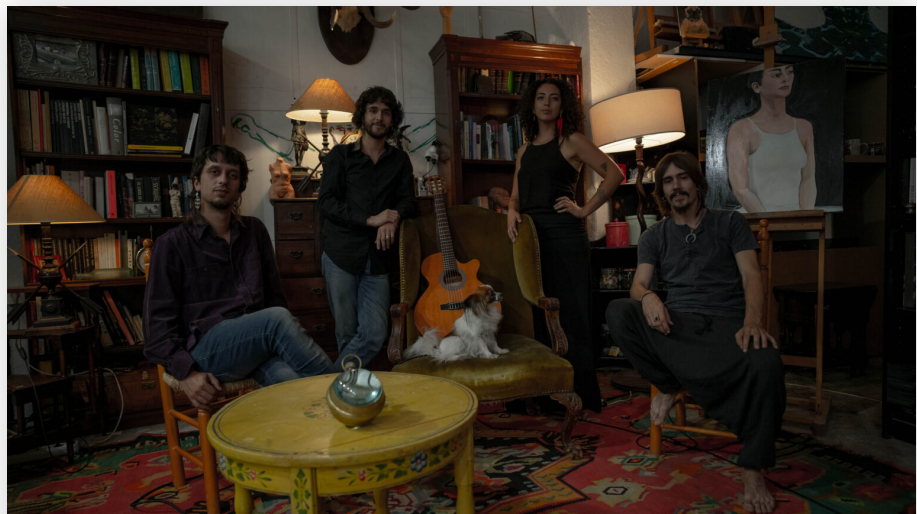
Para 2022, Berenice viajó a España. En Phantom Studio, ubicado en Rivas Vaciamadrid, y junto a sus amigos Los Locos Descalzos, realizó la grabación de Nido .

Fue un periodo en que no solo los pájaros cantaron más por la quietud humana, sino que la voz pajarera de Berenice fue intensamente creativa y cristalizó, posteriormente, en el proyecto que hoy en día le deparó varios galardones.