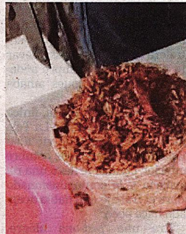
El arroz cantonés “especial” fue encontrado dentro de un bus.

Así lo dio el Ministerio de Seguridad Pública, el cual informó que los hechos ocurrieron la noche de este domingo 6 de octubre en el puesto de control de Lourdes de Abangares, en Guanacaste, dentro de un bus que viajaba de Puntarenas hacia el cantón de Monteverde, y que tuvo que pasar por dicho