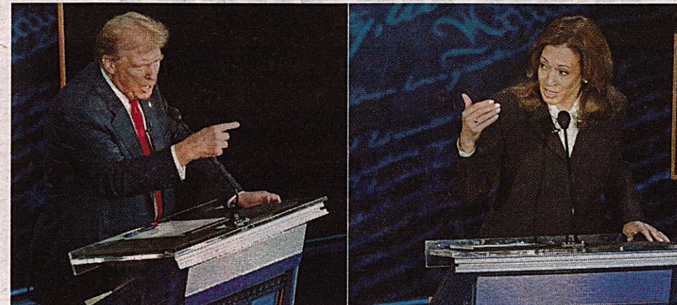
Donald Trump y Kamala Harris, durante el primer debate presidencial.

A continuación, los principales temas abordados durante este duelo político.