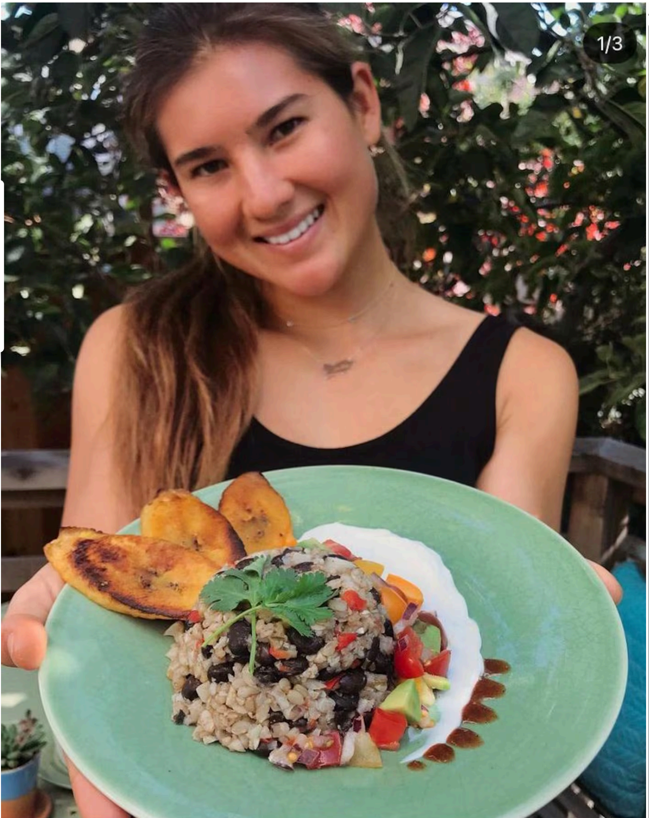
Brisa Hennessy es amante de la cocina, del surf y uno de sus platillos favoritos es el Gallo Pinto.

La surfista Brisa Hennessy también es muy seguida en las redes sociales por su faceta de cocinera, y sus padres contaron de quién heredó el gusto por preparar unos platillos riquísimos.