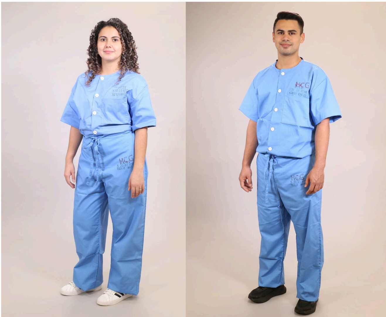
Esta es la nueva ropa hospitalaria que se usará en la CCSS: pijamas celestes para hombres y mujeres.

Más tarde, la institución aclaró que también habrá disponibles batas celestes para algunas cirugías o procedimientos o para las mujeres que sí prefieran usar bata.