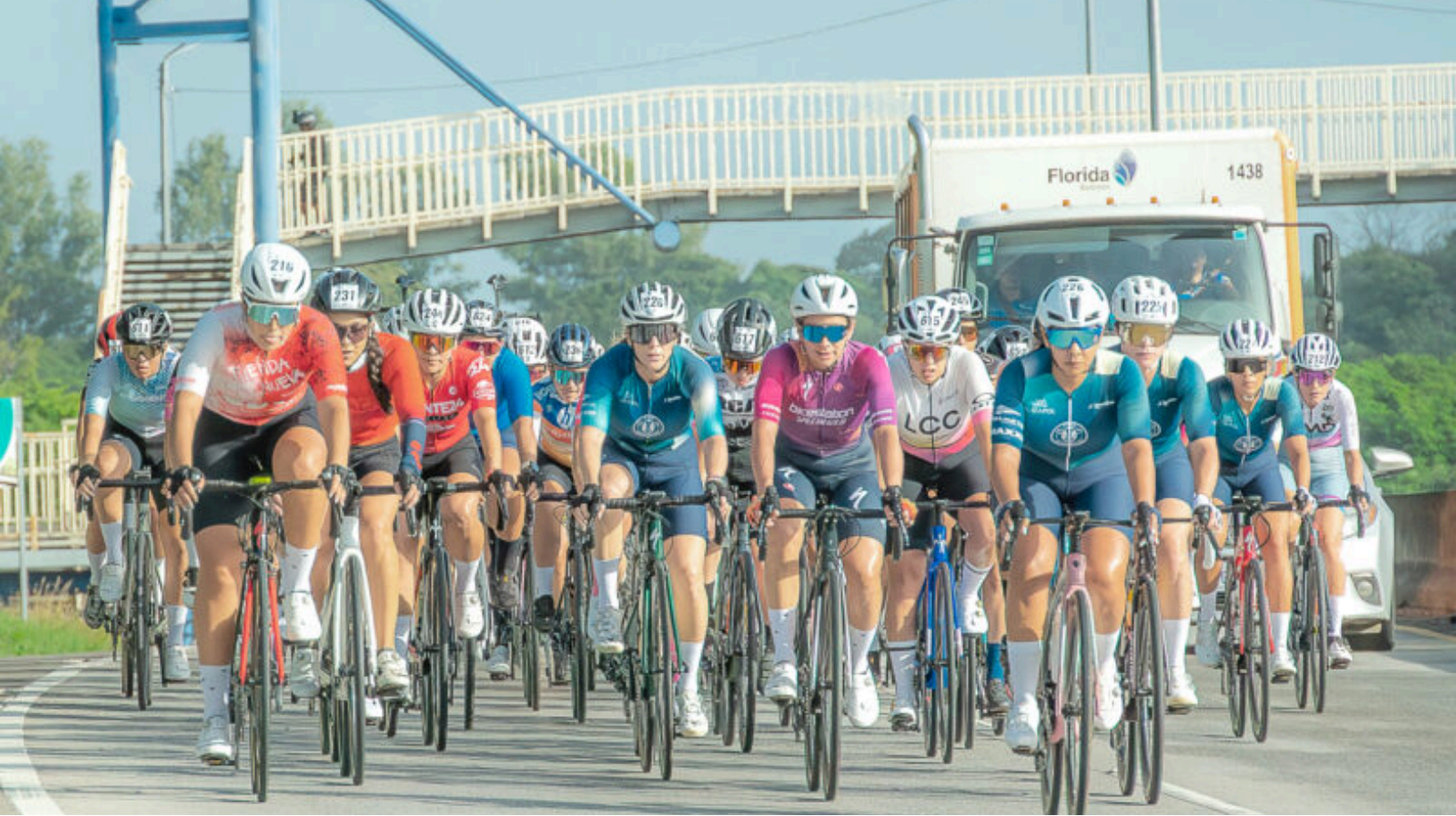
Las damas se mostraron muy felices.