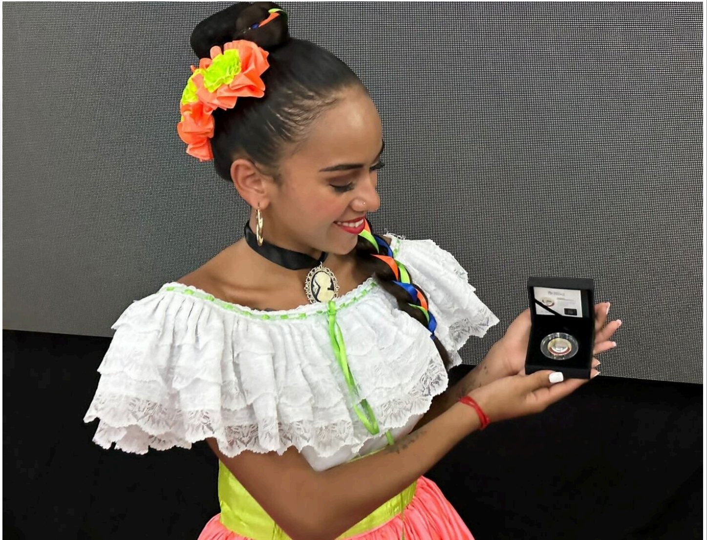
En Nicoya, el pasado 24 de julio, la Alajueliteña posó con su moneda.

“Realmente comenzó a crecer el tema cuando informé en el colegio que iba a faltar el 24 de julio para ir al acto oficial de presentación de la moneda, que fue en la Iglesia Colonial de Nicoya (iglesia San Blas de Nicoya).