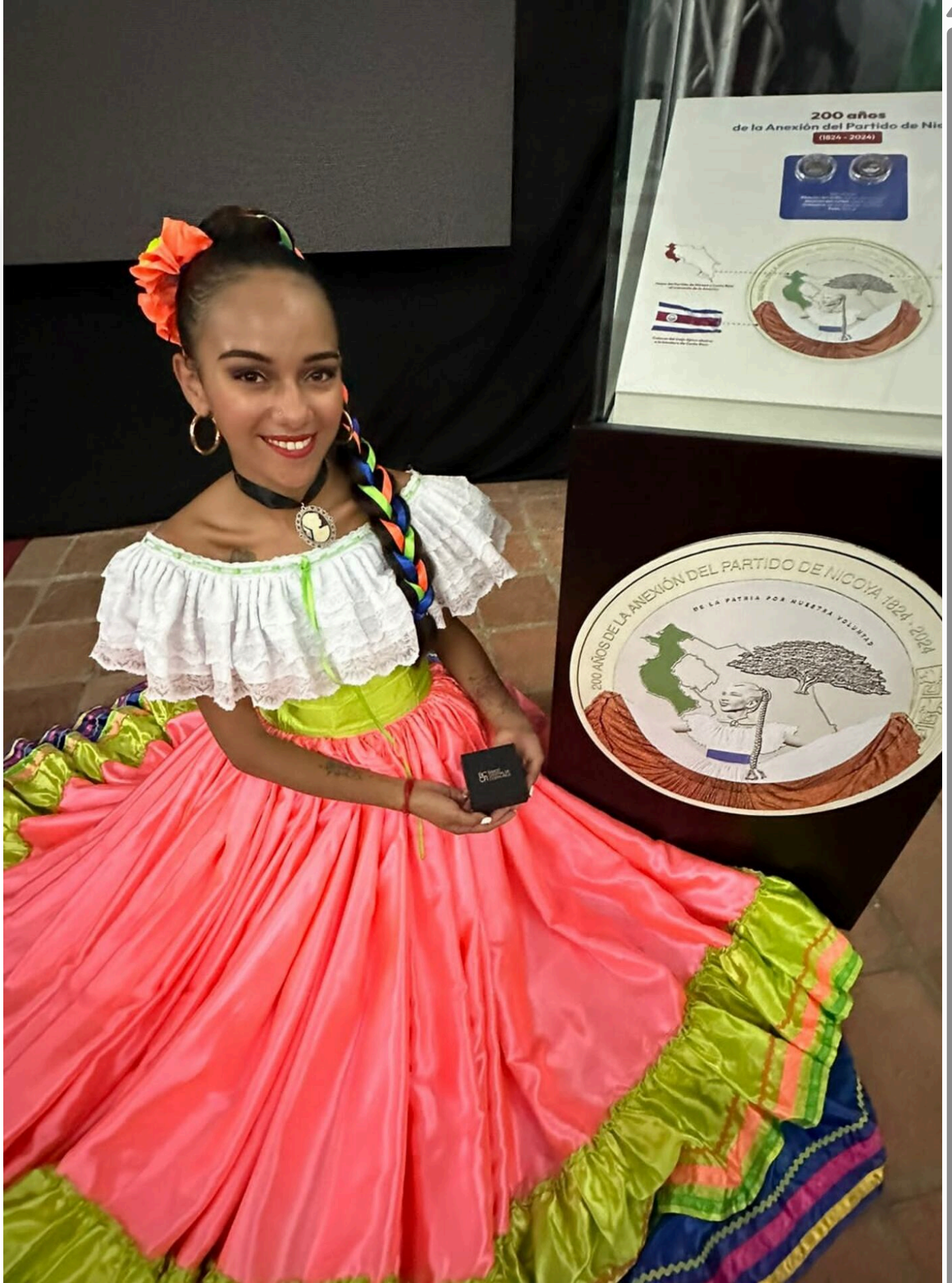
Cuando dijo que sí a las fotos, jamás se imaginó que era para una moneda.