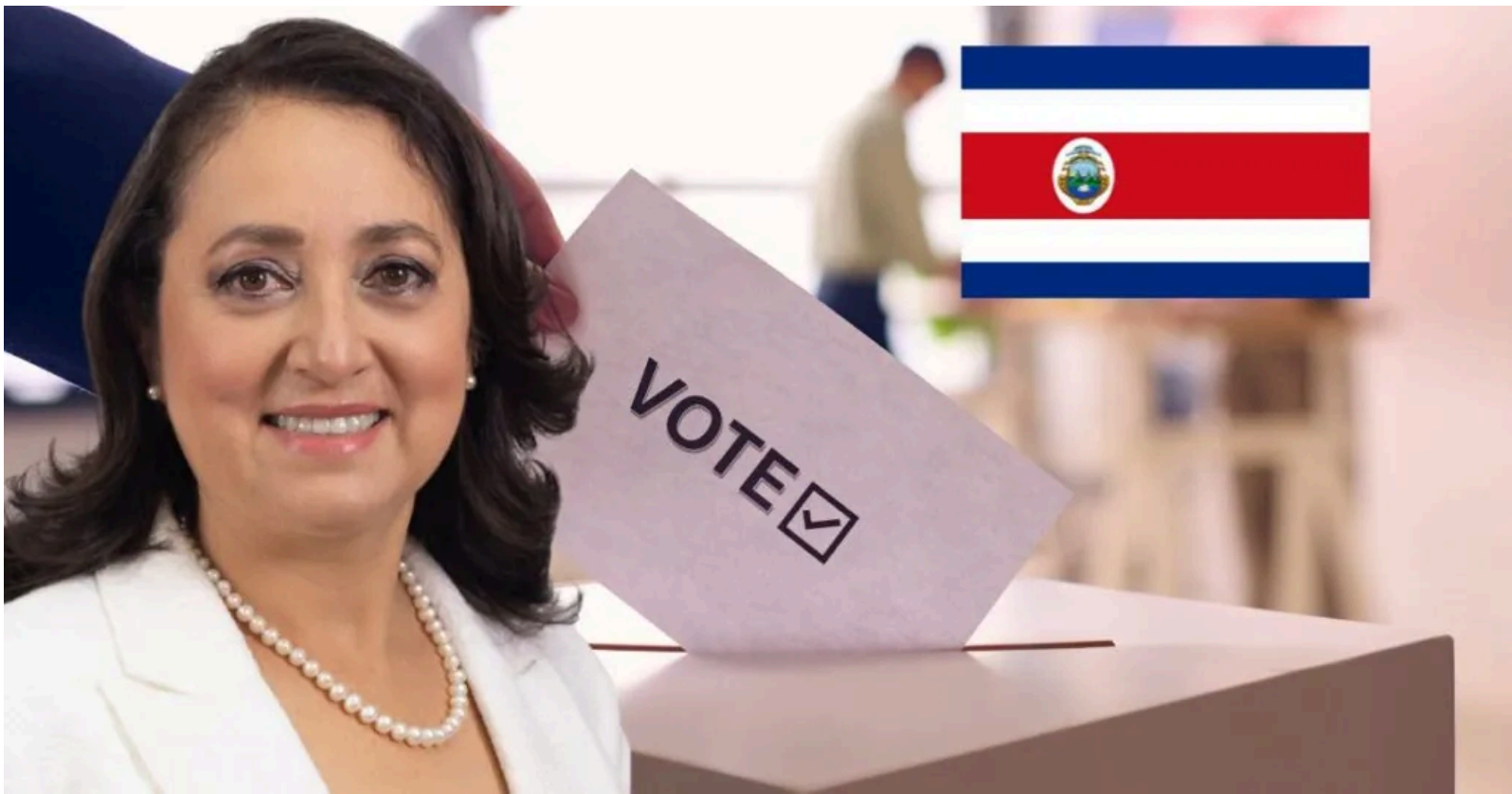
La diputada oficializó su intención de llegar a la Presidencia.