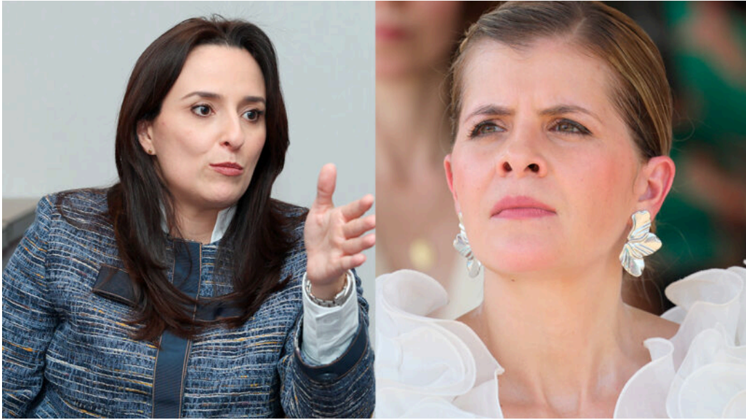
Fernández y Díaz salen favorables en redes sociales.