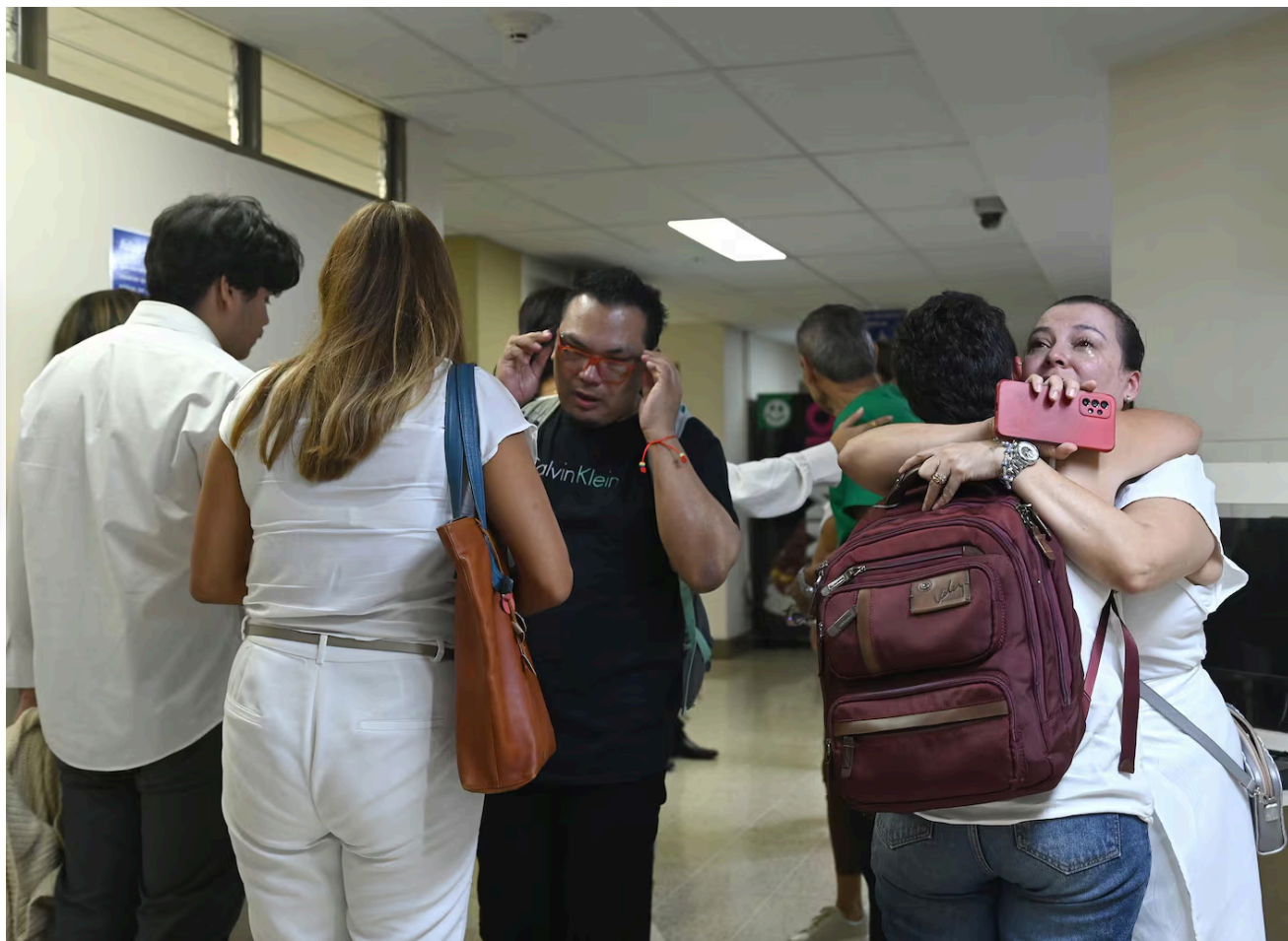
Familiares se abrazaron tras concluir la sentencia

“Se le notaba nerviosa, dando datos que no correspondían (...) La sentencia está completamente equivocada”, aseguró el defensor, quien esperará la sentencia integral para valorar alguna apelación.