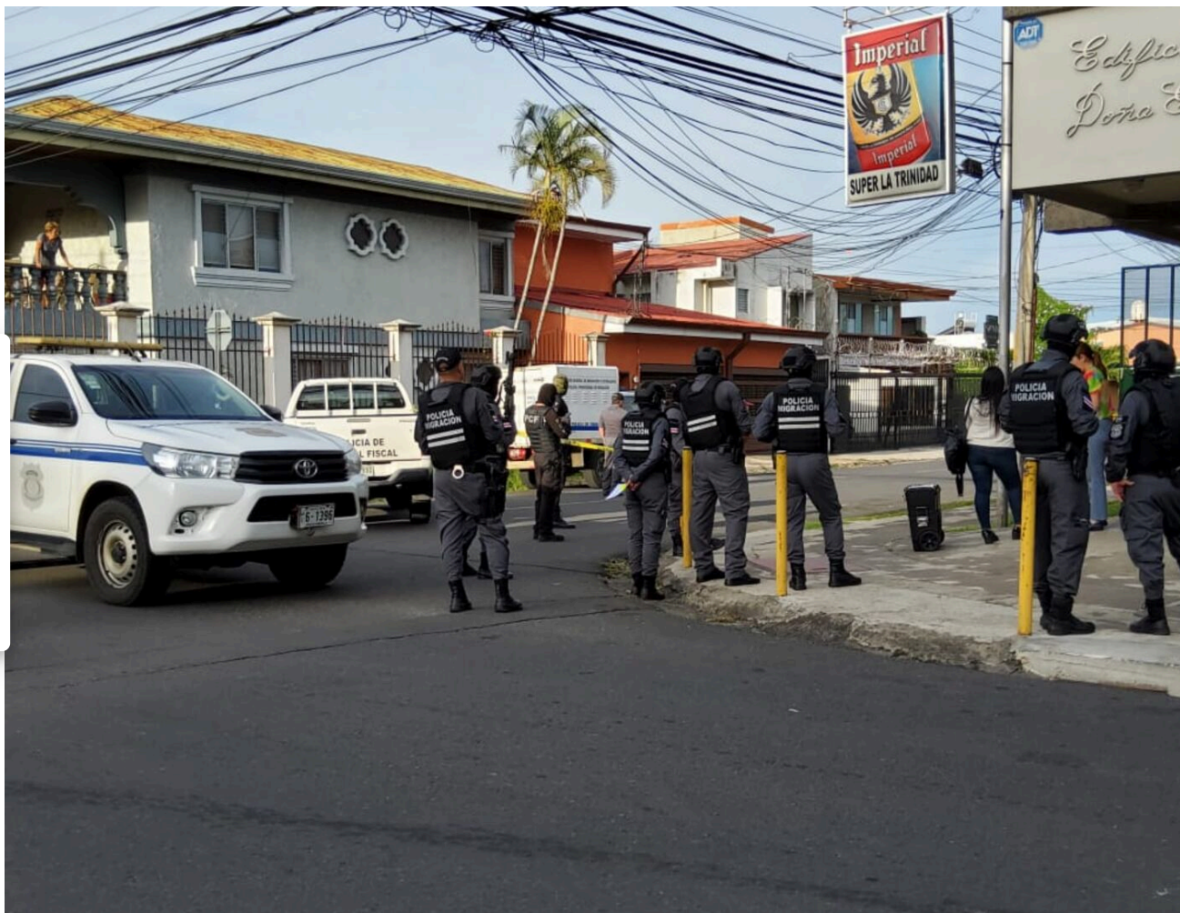
Detienen a sospechosos de explotación laboral contra dos jovencitas.

Dos jovencitas fueron rescatadas durante tres allanamientos que realizó la Policía Profesional de Migración, para capturar a dos sospechosos de explotación laboral.