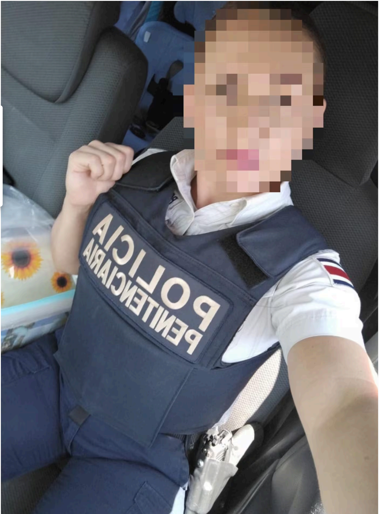
Las oficiales piden chalecos de seguridad hechos para ellas para dejar atrás las incomodidades.