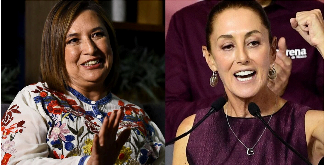
Claudia Sheinbaum (der), es la favorita en las encuestas frente a Xóchitl Gálvez, para la elección que se llevará a cabo, el domingo 2 de junio