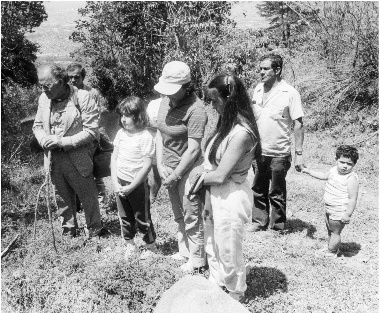
Varias personas se presentaron al lugar del crimen en Alajuelita a lamentar la pérdida de las siete vidas.

El abogado señaló que si bien el OIJ tenía carencias tecnológicas en 1986 para resolver crímenes de ese tipo, eso no justifica “que se hayan plegado los funcionarios a presiones políticas, mediáticas o sociales”.