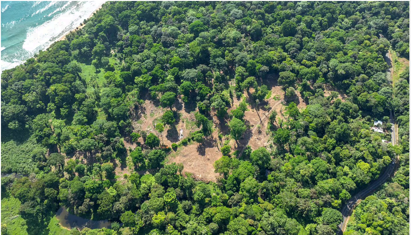
Detalle de un área boscosa parcialmente cambiada en el Refugio Gandoca-Manzanillo, en el Caribe Sur. Abajo, a la derecha, se ve la vía pública.