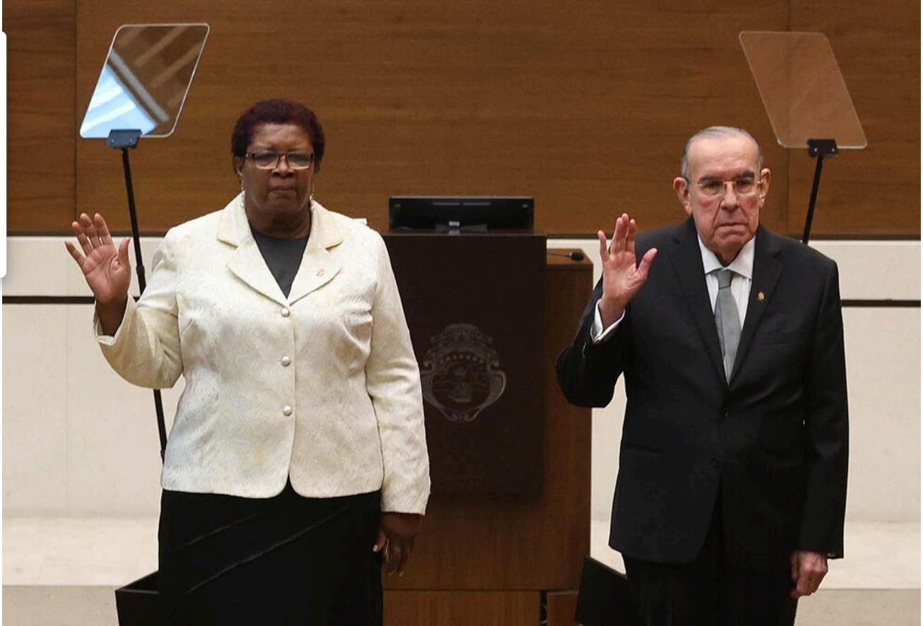
Ella fue electa en el cargo el 1 de mayo anterior.

Sí claro, hubo noches en las que mis hermanos y yo nos acostamos con hambre, en esos momentos uno como niño no soñaba con un futuro, no se puede soñar con el estómago vacío. Si yo conseguía un pedazo de pan se los guardaba a mis hermanos menores para que ellos pudieran comer algo. No hay palabras que puedan consolar un estómago vacío eso lo sé muy bien.