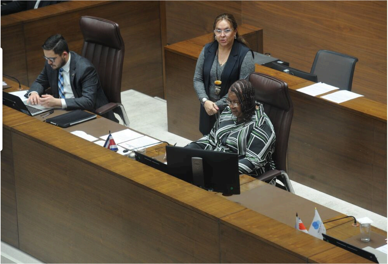
La legisladora es la primera vicepresidenta del Congreso afrodescendiente.

Lamentablemente la figura paterna tampoco estaba, la que siempre se hizo responsable con nosotros fue mi mamá. Mi papá también se fue para Estados Unidos, pero no precisamente para trabajar y ayudarnos, sino para hacer su vida.