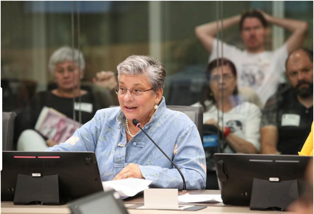
Anna Katharina Müller, ministra de Educación, ordenó investigar la negligencia cometida.

“Hemos ordenado, con la orientación suya (la del presidente Rodrigo Chaves), la revisión del reglamento de evaluación de los aprendizajes para endurecer las sanciones contra estos estudiantes que realicen este tipo de actos con tanta violencia, lo vamos a someter Consejo Superior de Educación”, dijo Müller este miércoles.