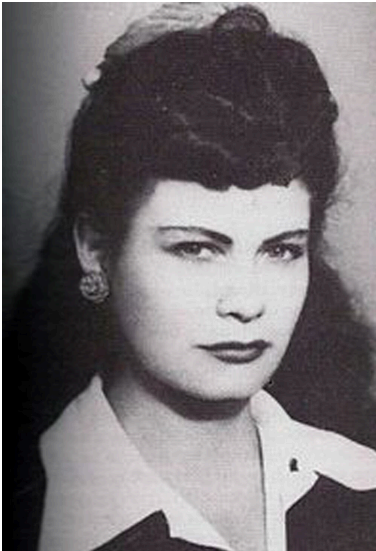
Eunice Odio poseía una sólida cultura literaria, artística, estética y metafísica.