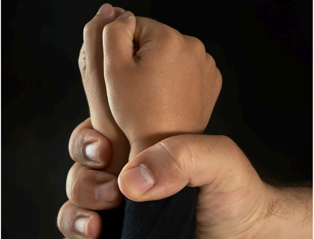
Una pareja de esposos obligaba a una niña a levantarse temprano para realizar tareas domésticas, agrícolas y de construcción. Foto con fines ilustrativos (shutterstock)

De acuerdo con el Ministerio Público, la víctima fue criada en Nicaragua por su bisabuela hasta los ocho años, cuando fue entregada a la madre de Bejarano en la ciudad de León.