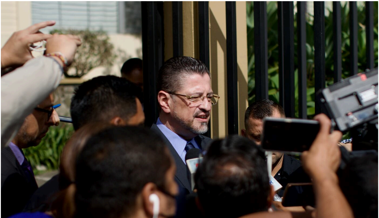
Rodrigo Chaves habría sido imprudente al hablar del estudiante que cometió la agresión.

Este tiene un papel fundamental porque está llamado a la protección inmediata de los niños. Un PANI que ha sido criticado, que tiene que ser reestructurado, y que tiene muy pocos recursos, pero en este caso específico sí le dio acompañamiento a la víctima.