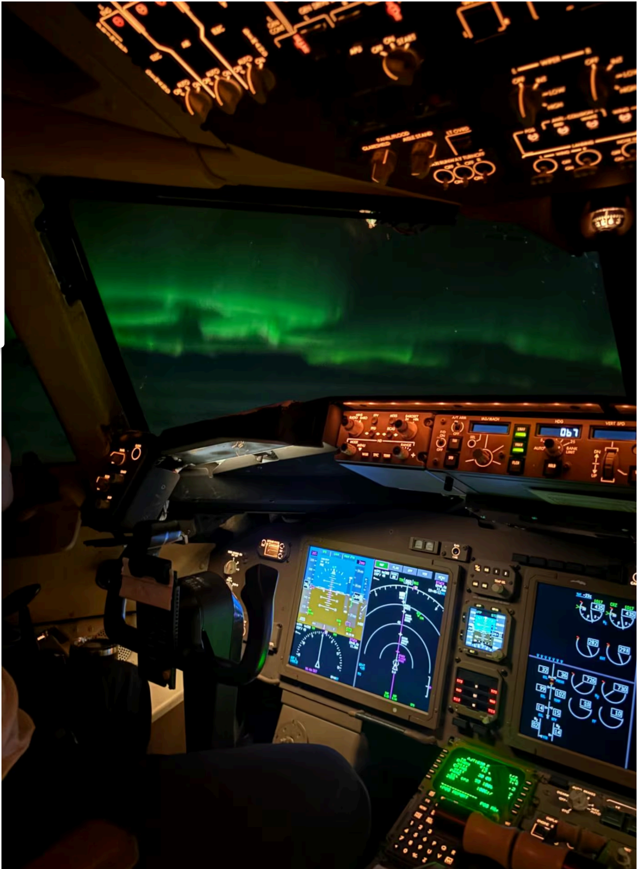
Andrea conoció las auroras boreales gracias a su trabajo.