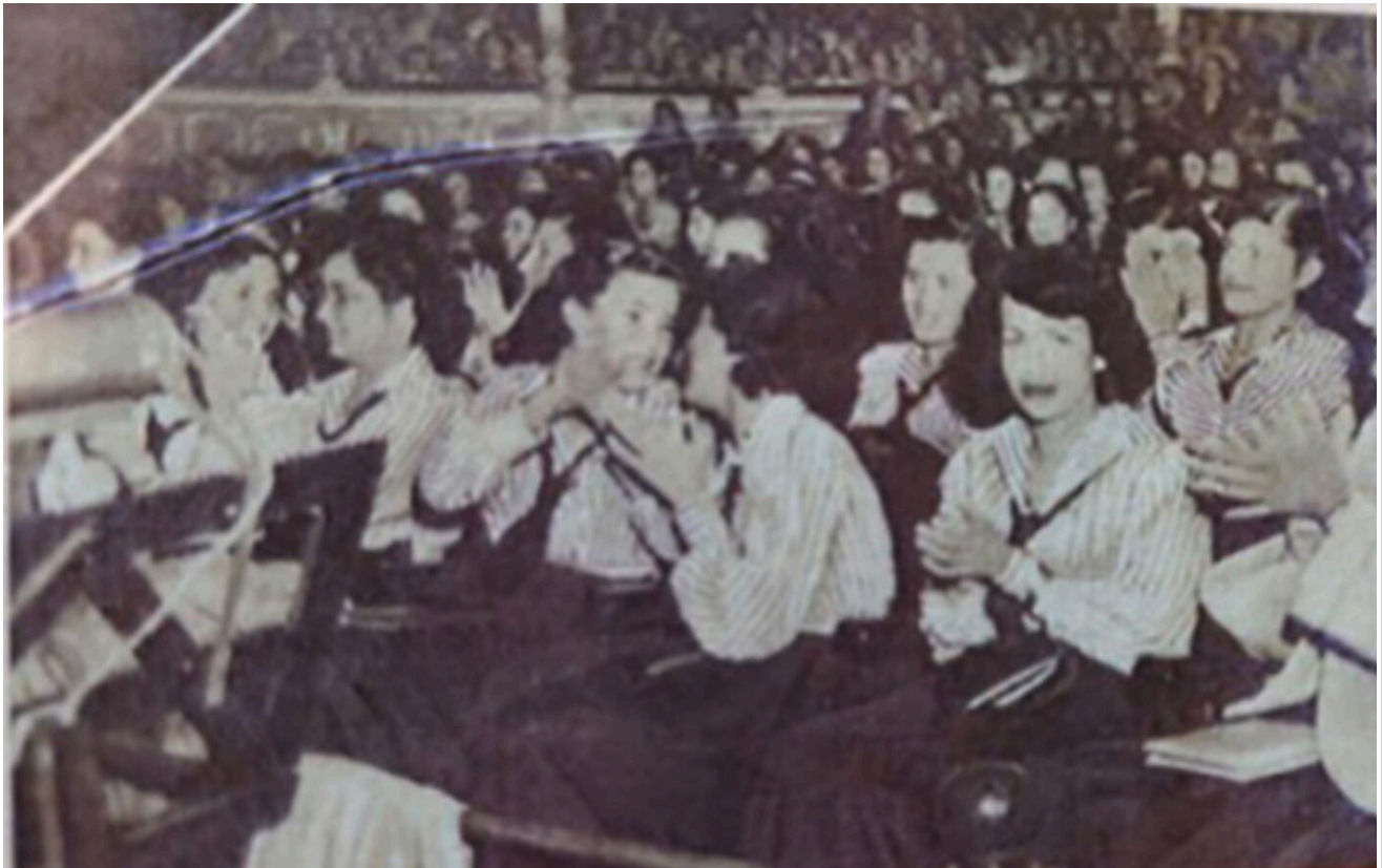
Estudiantes del Colegio Superior de Señoritas en una de las presentaciones de la compañía Lope de Vega en el Teatro Nacional. Tomado de Teatro de España en América. 1951. (Archivo)

"Muchas personas que fueron claves para que la historia teatral de este país diera un giro fundamental, han permanecido en un olvido no solo injusto, sino a todas luces ofensivo".