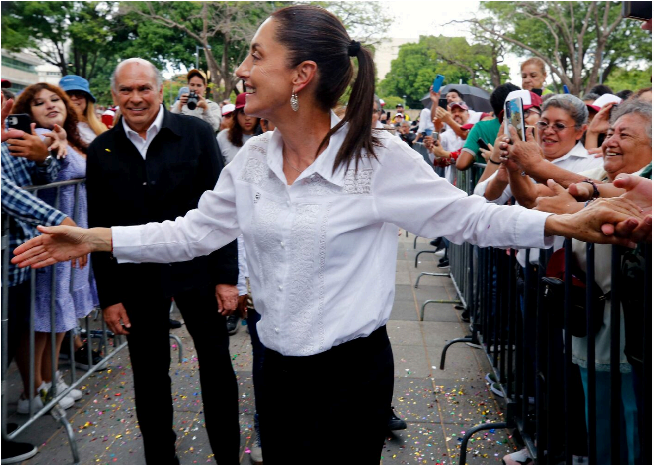
Claudia Sheinbaum fue parte del equipo que obtuvo el Premio Nobel de la Paz en 2007 por su contribución a un estudio sobre el cambio climático, siendo coautora del capítulo sobre la industria en el informe 'Mitigación del cambio climático'.

A lo largo de su trayectoria, participó activamente en la defensa de la educación gratuita. Se autodenomina "hija del 68" en referencia a la lucha estudiantil de 1968 en la que sus padres participaron antes de la matanza de Tlatelolco. En 1987