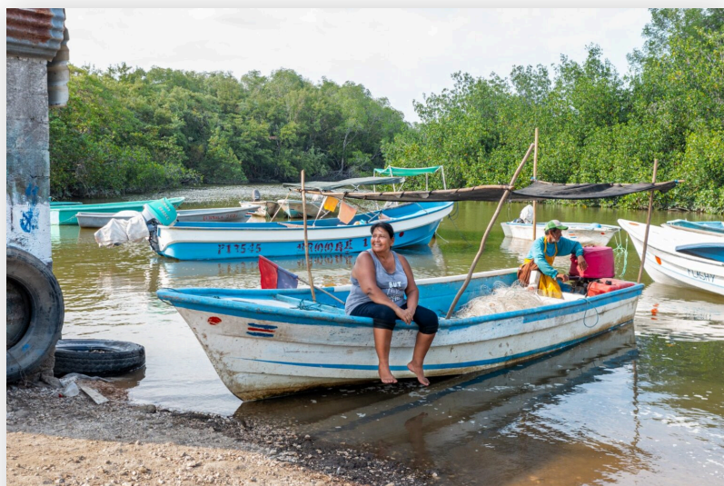
En un puerto Thiel en la península de Guanacaste, una mujer pescadora y molusquera comparte con el equipo de producción de Quince UCR después de

“Las comunidades pesqueras y, en general, las comunidades costeras han sido olvidadas por las políticas públicas y políticas estatales y las mujeres pescadoras artesanales igualmente lo han sido. Esta serie hace visible las problemáticas de ellas, sus sueños y anhelos y las relaciones ancestrales con el mar”, relató la productora.