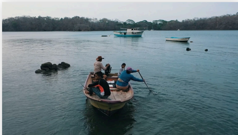
Una mujer pescadora de Paquera rema en la panga junto con sus hijos y un vecino de la comunidad.

La expansión turística, la sobreexplotación de los océanos y en específico del golfo de Nicoya, la contaminación de las aguas y las sedimentaciones ocasionadas por extractivismos en los ríos, la presencia de actividades monocultivo y otras formas de despojo tienen repercusiones dramáticas en los territorios costeros, los cuales, históricamente, han insistido en la deficiente atención estatal y las difíciles condiciones para el bienestar.