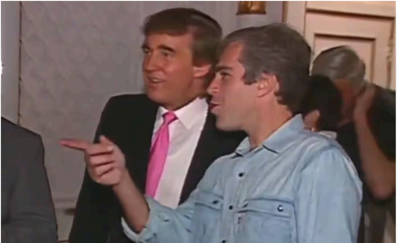
Imagen tomada del video donde se ve a Donald Trump y a Jeffrey Epstein.

Washington, Estados Unidos. Los demócratas mantuvieron este miércoles la presión sobre el presidente estadounidense, Donald Trump, para intentar forzar la publicación de archivos de la investigación sobre el delincuente sexual Jeffrey Epstein , un caso que ha puesto en aprietos al gobierno.