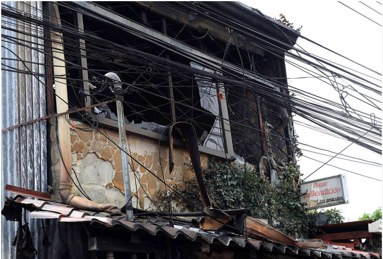
Las llamas bloquearon la única salida del complejo de cuartos.

José recuerda a la joven como una excelente madre que, además, cuidaba de su propio hermano, de tan solo 12 años. Según cuenta, era común que el niño también durmiera con ella y sus tres hijos para poder ir a la escuela. Ese día, no se quedó en la vivienda. “La tragedia pudo haber sido mayor”, afirma.