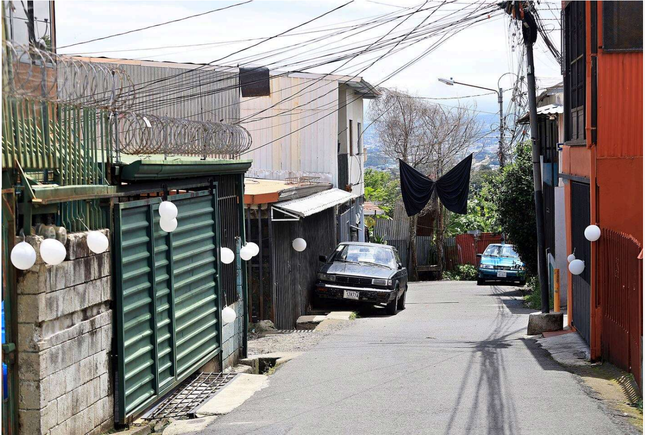
Familiares colocaron globos en las calles en memoria de los fallecidos.

Al salir, recuerda, levantó la mirada y el humo ya salía por las ventanas y entre las láminas de zinc.