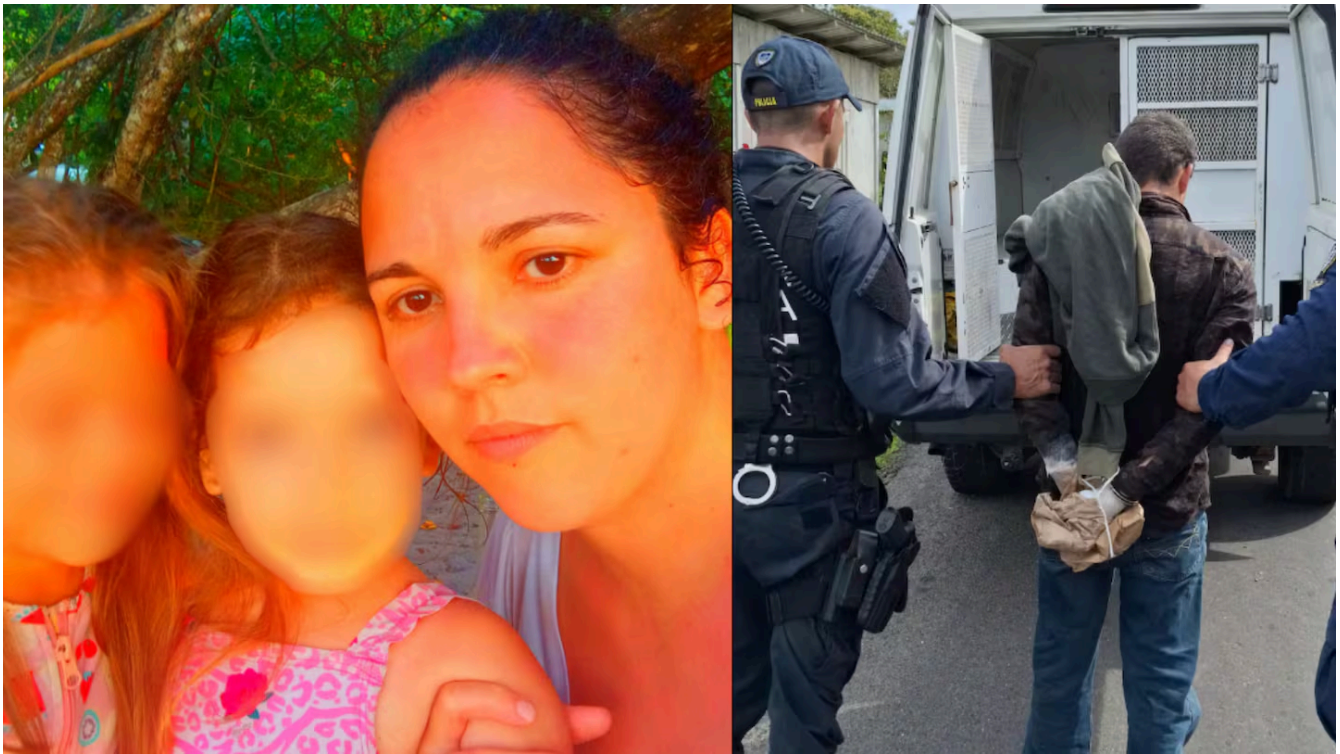
Hija menor de este matrimonio presenció el femicidio de su madre.