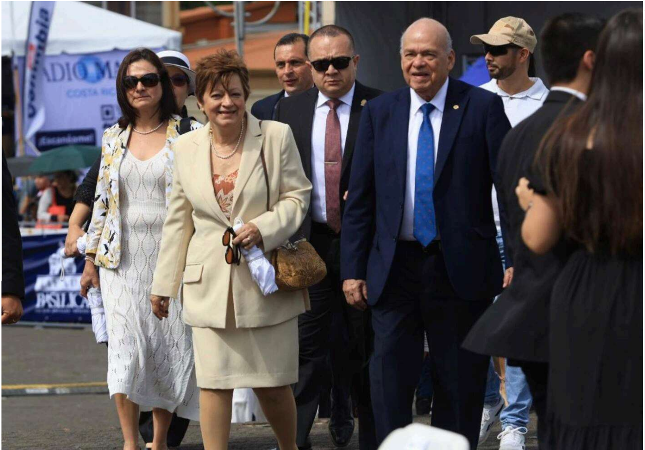
Eugenia Zamora, presidenta del TSE; Gerald Campos, ministro de Justicia; y Orlando Aguirre, presidente de la Corte, en la homilía del 2 de agosto.