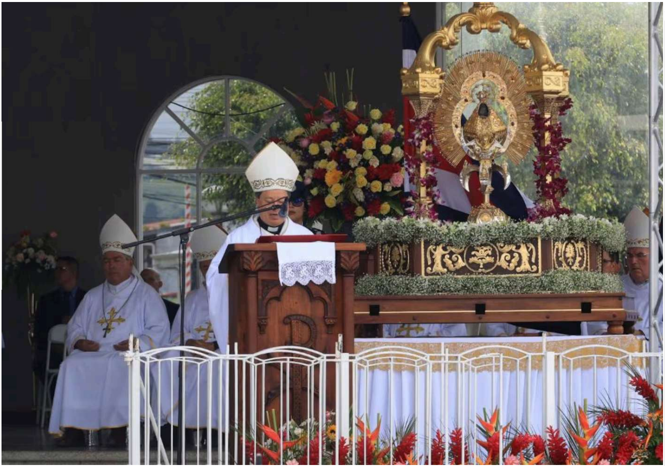
José Rafael Quirós se dirigió al público durante la homilía de este 2 de agosto, frente a la Basílica de los Ángeles, en Cartago.

El arzobispo de San José, José Rafael Quirós , hizo un llamado a frenar todo tipo de violencia en el país, en especial la agresión a las mujeres, durante la homilía de la solemne eucaristía en honor de la Virgen de los Ángeles , en la plazoleta de la basílica, este sábado.