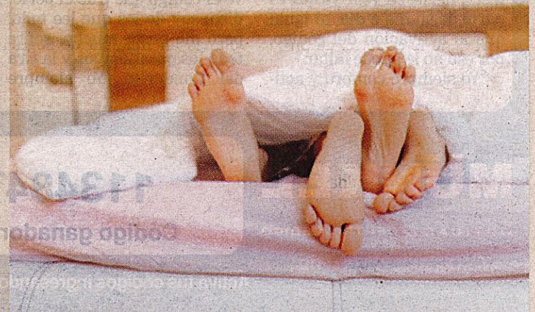
Los jóvenes entre los 15 y los 34 años se contagian mucho.

tarse una mujer que le hace el sexo oral a un hombre, que un hombre que le hace el sexo oral a una mujer.