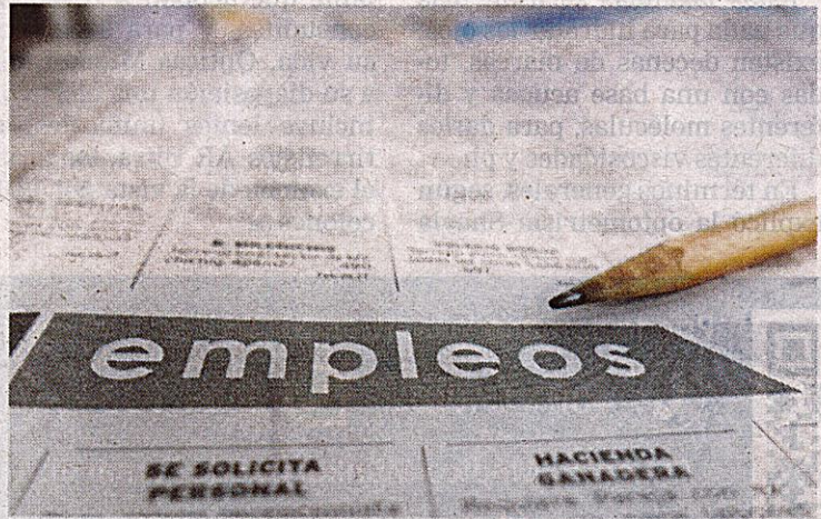
Hoy podría ser su día para encontrar trabajo.

Además, ofrecerán becas de hasta un 95% de descuentos en técnicos de alta demanda laboral y talleres gratuitos.