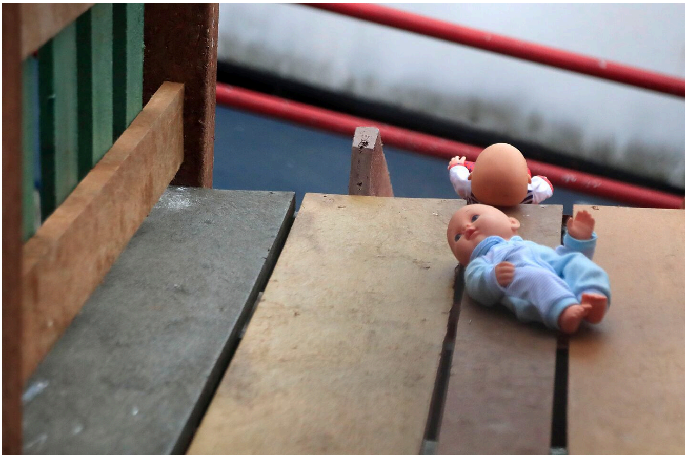
Uno de cada dos bebés nace sin padre en su registro de nacimiento.

En el caso de las pruebas de ADN, si el resultado de paternidad es negativo, la progenitora podrá informar del nombre de otro posible padre y realizar un proceso similar hasta dar con el padre biológico del menor, pues el fin de la ley es que el menor tenga un padre identificado.