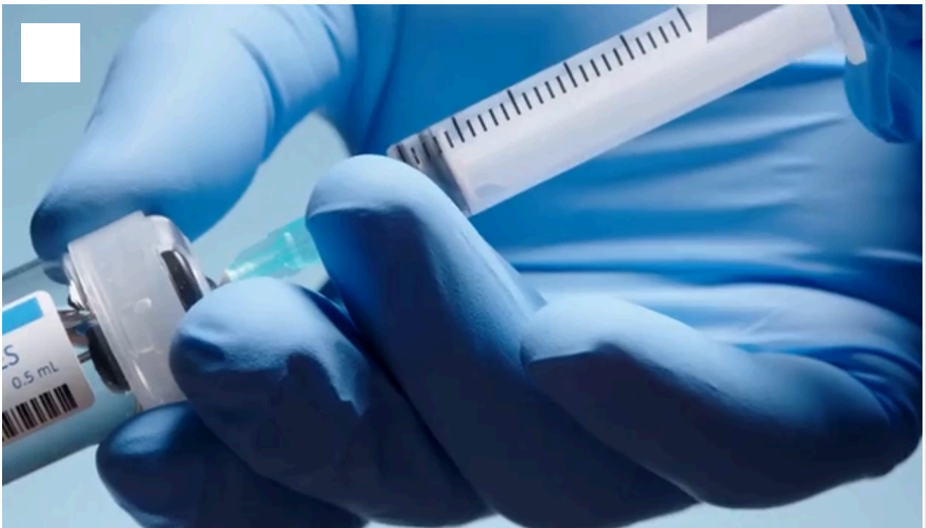
Varones de 10 años se vacunarán contra el papiloma

Más de 40 países ya incluyen la vacunación de hombres en su preadolescencia. Dentro de ellos están España, Alemania Reino Unido, Australia, Nueva Zelanda, Irlanda, Argentina, Brasil, Canadá, Chile, Estados Unidos y Panamá.