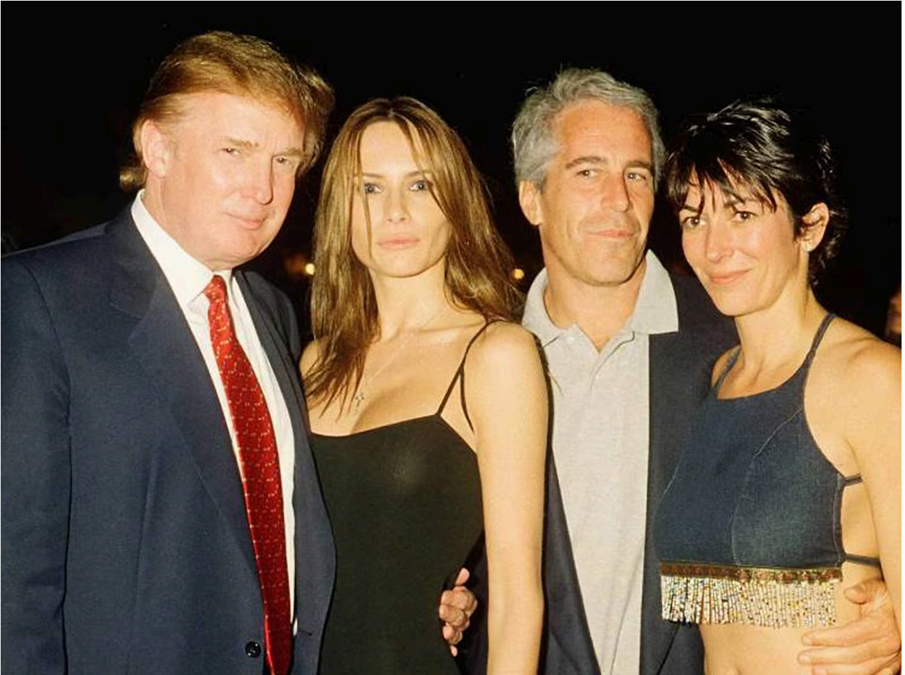
Donald Trump y Jeffrey Epstein tenían mucha cercanía, así se refleja en muchas fotos que tienen juntos.

Pero ¿por qué el caso ha suscitado semejante indignación?