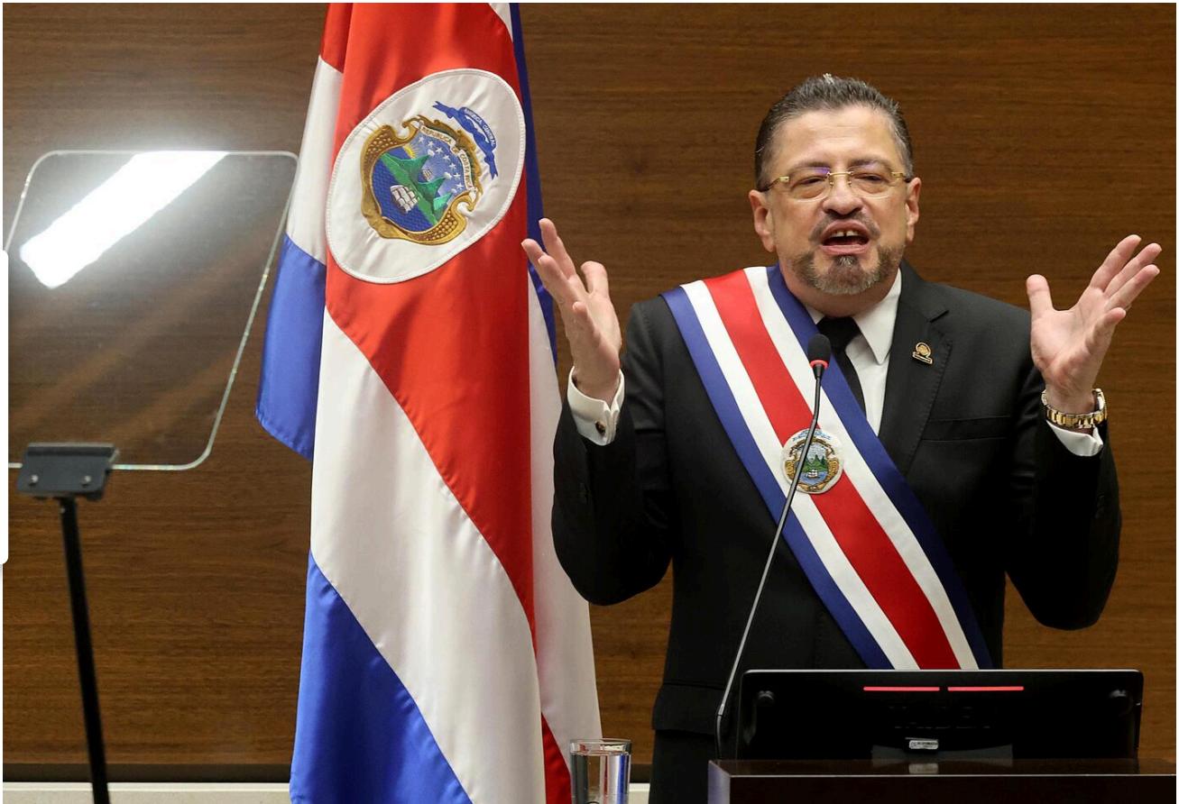
Activista le pidió a Rodrigo Chaves que deje de tratar mal a las mujeres.

declare alerta nacional para frenar este tipo de violencia.