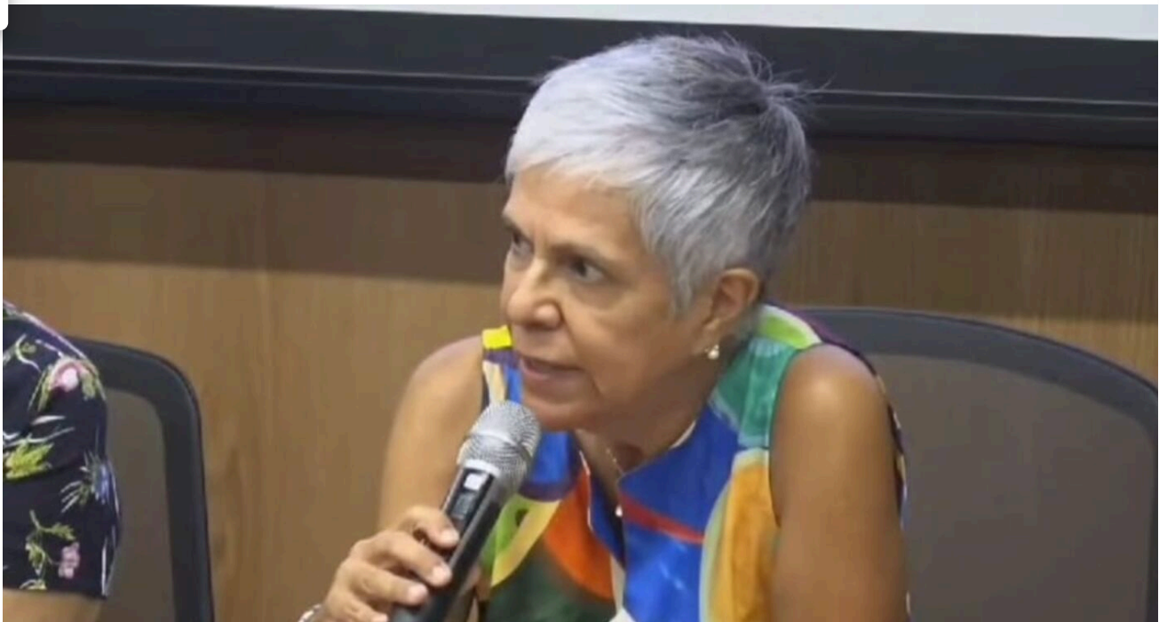
Ana Hidalgo le pide al presidente que ayude a disminuir la violencia contra las mujeres, en lugar de aumentarla.

"También es un llamado al Poder Ejecutivo, es un llamado al Instituto Nacional de las Mujeres (Inamu) a que retome su responsabilidad de exigirle a todo el Estado cumplir con la responsabilidad que tiene para detener la masacre contra las mujeres en nuestro país.