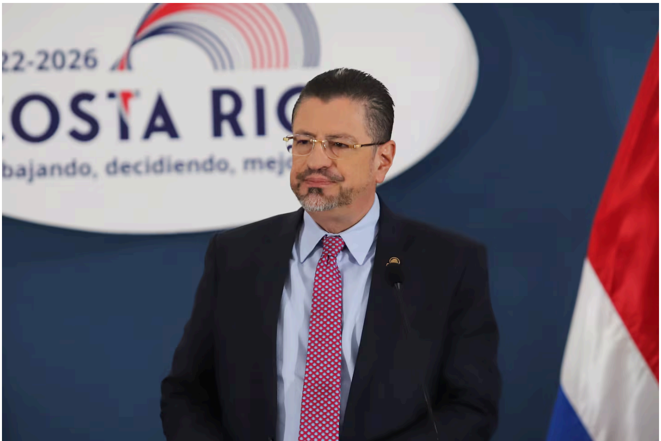
El presidente Rodrigo Chaves mencionó, en reiteradas ocasiones, el nombre una jueza en conferencia de Prensa.

El arancel de importación bajó de un 35% a un 3,5% para el arroz con cáscara y a un 4% para el arroz pilado. Ahora, esa reducción quedó congelada.