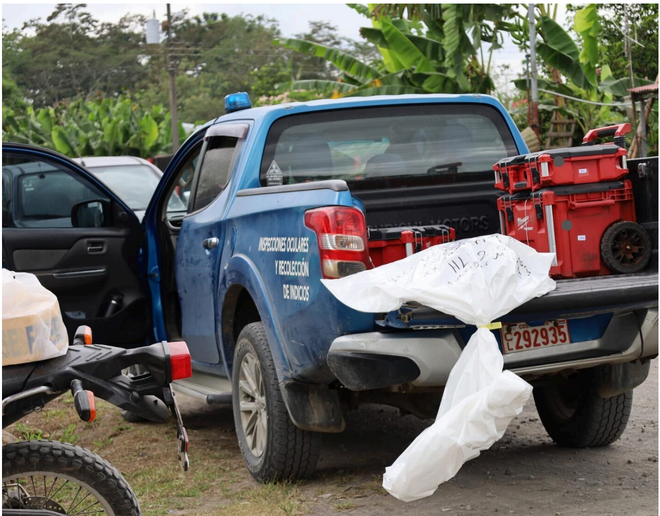
Los restos recolectados en la finca de Cariari, Pococí, fueron trasladados a la Medicatura Forense.

Su madre la describió como una joven humilde, sin vicios y muy dedicada al hogar.