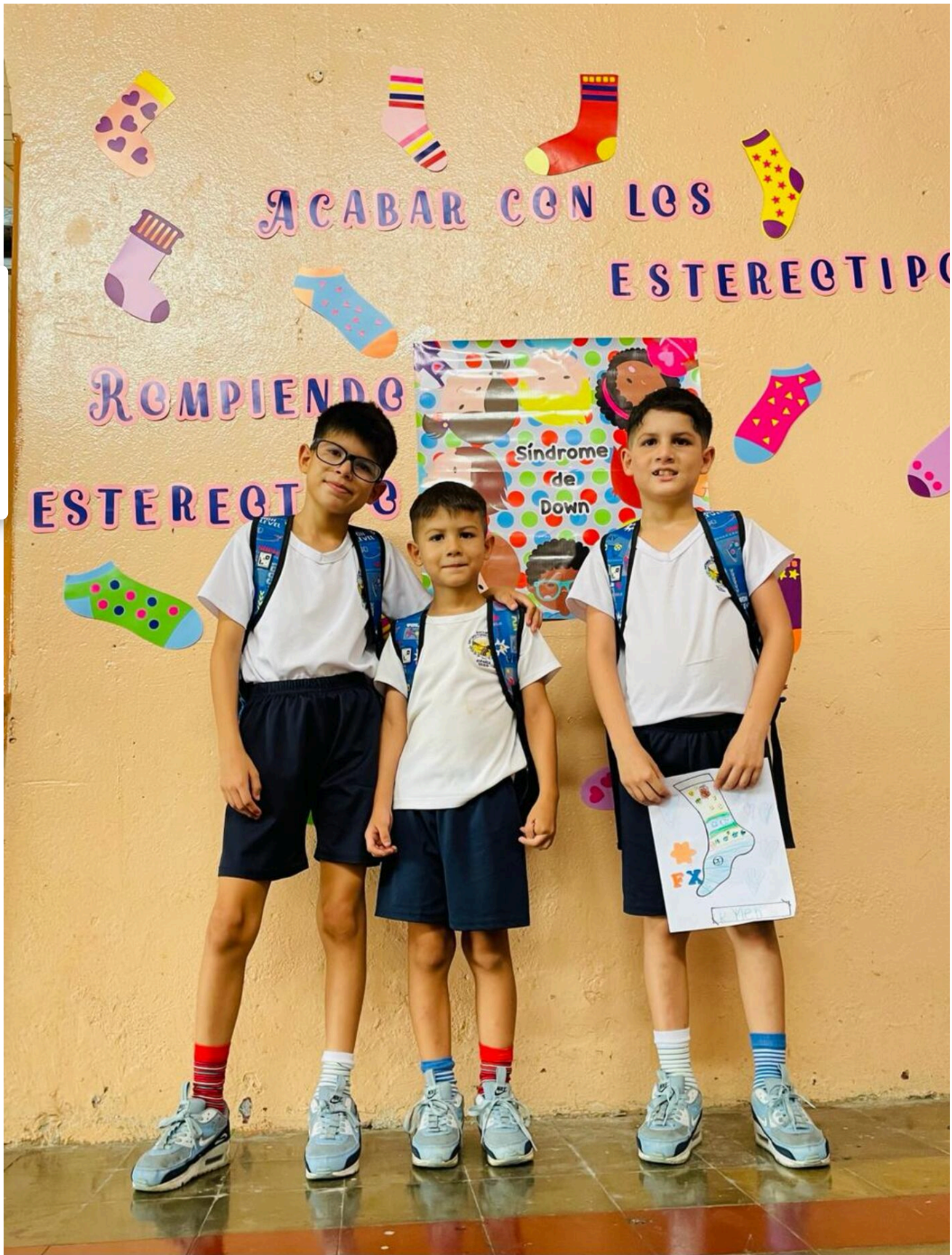
Estos hermanitos son selectivos con la vestimenta y no pueden usar camisas de botones para ir a la escuela.