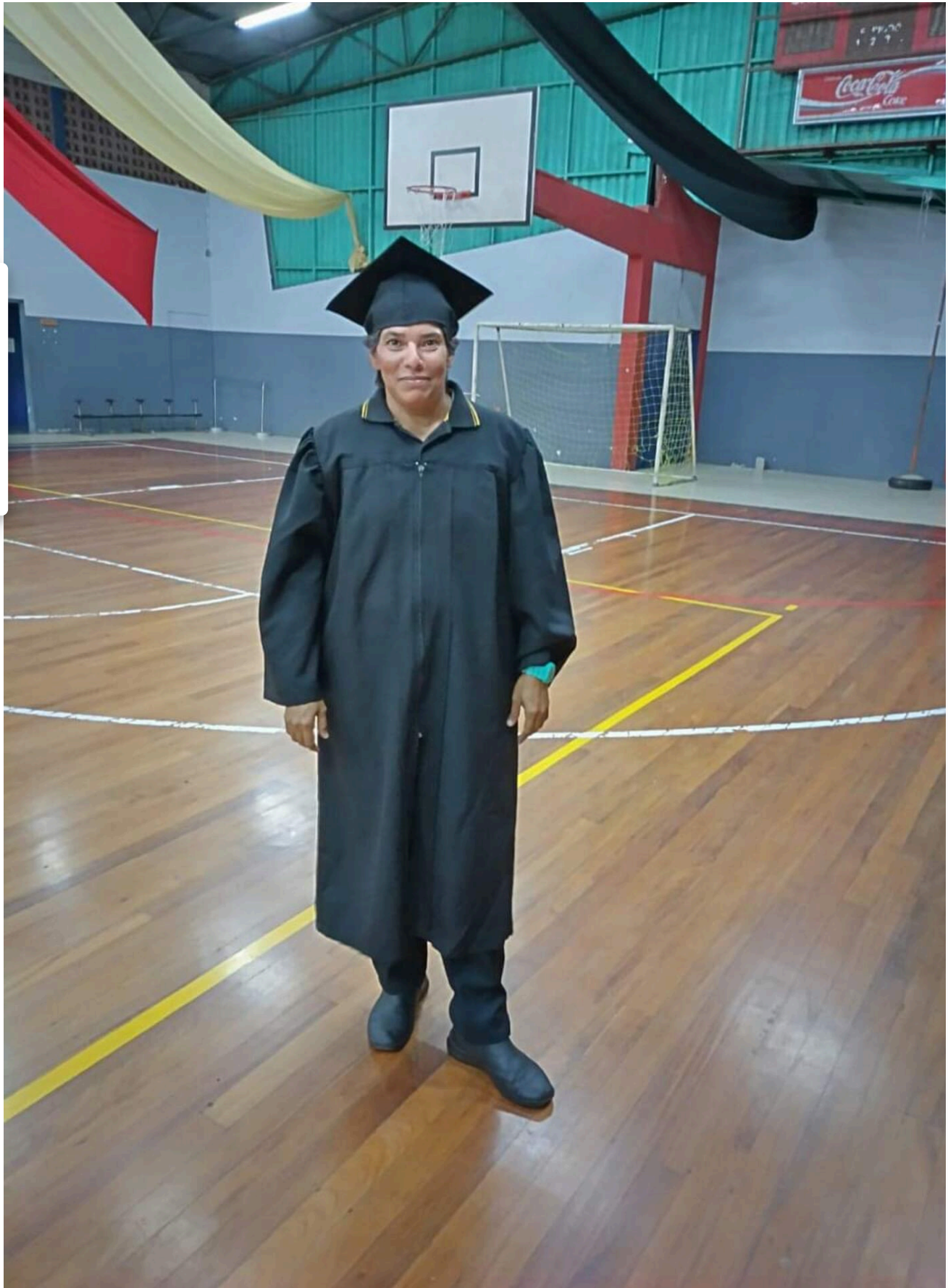
Ella está que no se cambia por nadie por haber ganado el bachillerato.