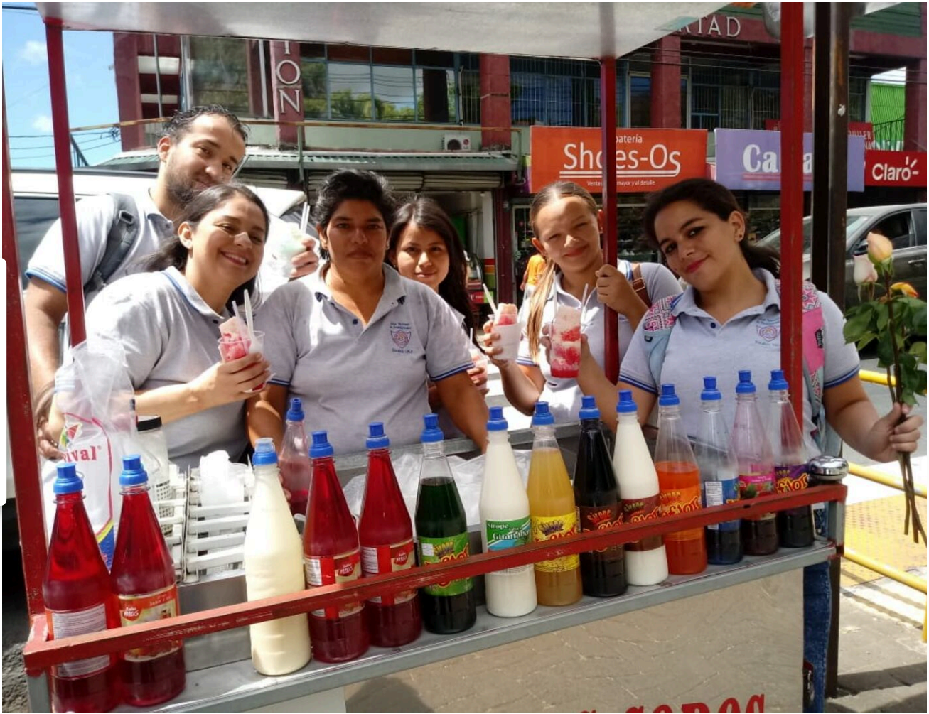
La valiente disfruta mucho su trabajo porque lleva felicidad a la gente.