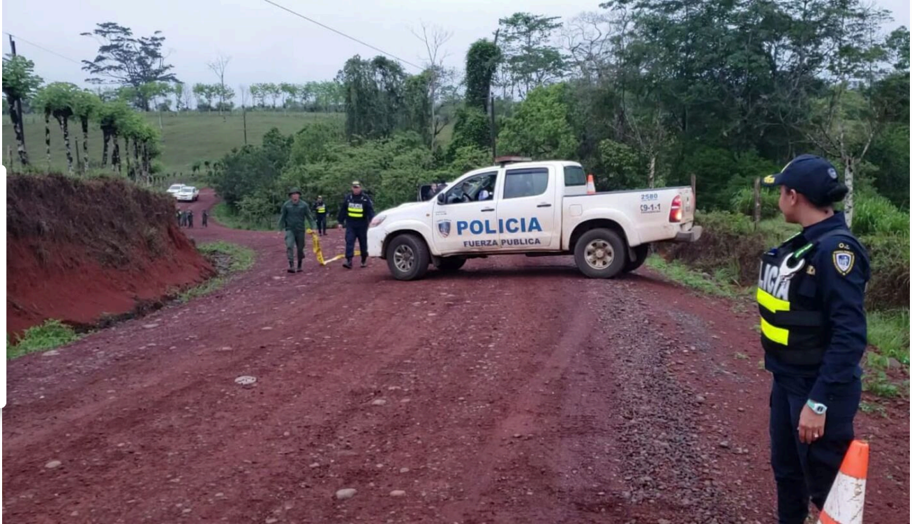
El hecho de muerte ocurrió en Pocosol de San Carlos, zona norte del país.

De acuerdo con la versión preliminar, Valverde llegó a la vivienda en la que vive el adolescente y buscaba a la mamá del joven, supuestamente intentó agredirla y en ese momento el adolescente habría intervenido.