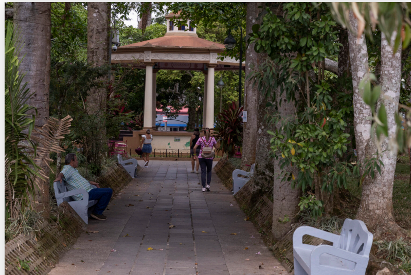
El pasado lunes, en el parque Simón Ruiz, frente a la iglesia de Palmares, numerosos adultos mayores conversaban en las bancas, tres señoras ofrecían lecturas de la Biblia y varios niños estaban en el área de juegos.

A nivel nacional, aumentaron los intentos de suicidio a partir de la pandemia, de acuerdo con los datos del Ministerio de Salud, pasando de 1.786 casos en 2020, a 2.159 en 2021 y a 2.896 en 2022.